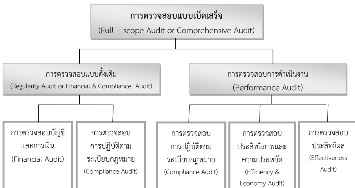
แผนภาพที่ ๑ แนวคิดของการตรวจสอบภาครัฐสมัยใหม่

แนวคิดเรื่องการตรวจสอบการดำเนินงานนี้ ได้ถูกนำมาใช้ในภาครัฐอย่างเป็นทางการในสำนักงานการตรวจเงินแผ่นดิน ตั้งแต่เริ่มใช้พระราชบัญญัติตรวจเงินแผ่นดิน พ.ศ. ๒๕๒๒ และได้พัฒนาแนวทางและวิธีการตรวจสอบต่อเนื่องตลอดมาจนถึงปัจจุบัน ดังนั้น การตรวจสอบภาครัฐจะดำเนินการควบคู่กันไประหว่างการตรวจสอบทางการเงินและการตรวจสอบการดำเนินงาน ดังแผนภาพที่ ๑